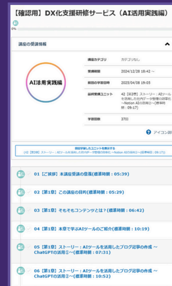
プラットフォームイメージ